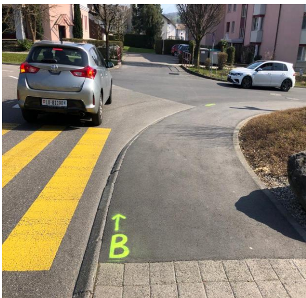
Diesen „B“s entlang folgen

Bitte benützen Sie nicht den normalen Praxiseingang.